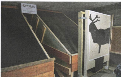
Ferdig skive og kulefang.

Å realisere en riflebane i et område som i økende grad er følsomt for støy virket vanskelig. Det var da foreningen begynte å tenke i mer kreative baner. Det har tatt tid, dugnadsinnsats og mye tankevirksomhet, men våren 2019 ble altså den ferdige banen tatt i bruk.