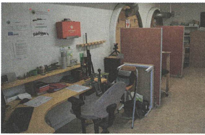
Standplassen, inkludert ladestasjon.