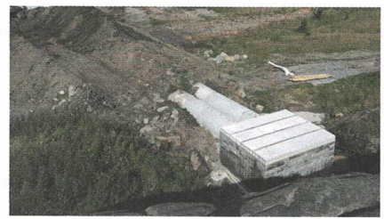
Banen under bygging.

Foreningen har både elektroniske skiver og pappskiver klare til bruk på skytebanen. Kulefanget er ganske annerledes enn hva man finner på andre 100-meters-